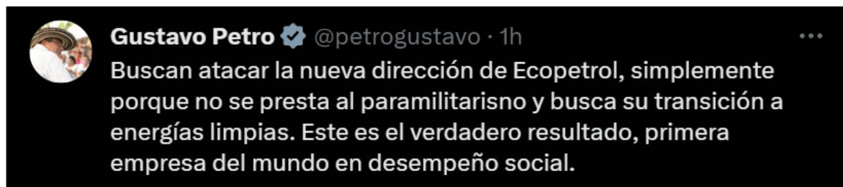
Presidente Petro en X.

El presidente Petro ha destacado la importancia de la resistencia de Ecopetrol ante intentos de desestabilización, argumentando que la empresa está siendo atacada debido a su rechazo al paramilitarismo y su enfoque en la transición hacia energías limpias.