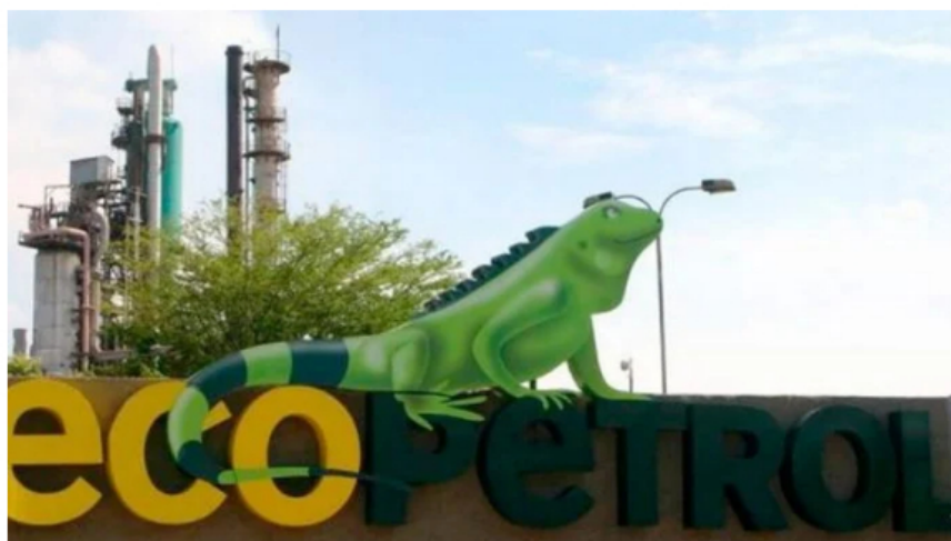
Ecopetrol, tercera mejor empresa global en prácticas de sostenibilidad: índice Dow Jones.

El índice público Dow Jones asignó a la petrolera colombiana, Ecopetrol , una calificación destacada en el componente ambiental, mejorando ocho puntos respecto a 2022.