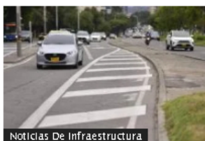
Noticias De Infraestructura

PIB de México creció 3,1 % en 2023, pero debajo de expectativas