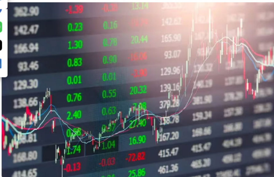
Acción de Ecopetrol cae: precio y cotización en bolsa hoy 30 de enero de 2024 Crédito: (Shutterstock) (

Así se comportan las acciones de Ecopetrol en la Bolsa de Valores de Colombia este 30 de enero