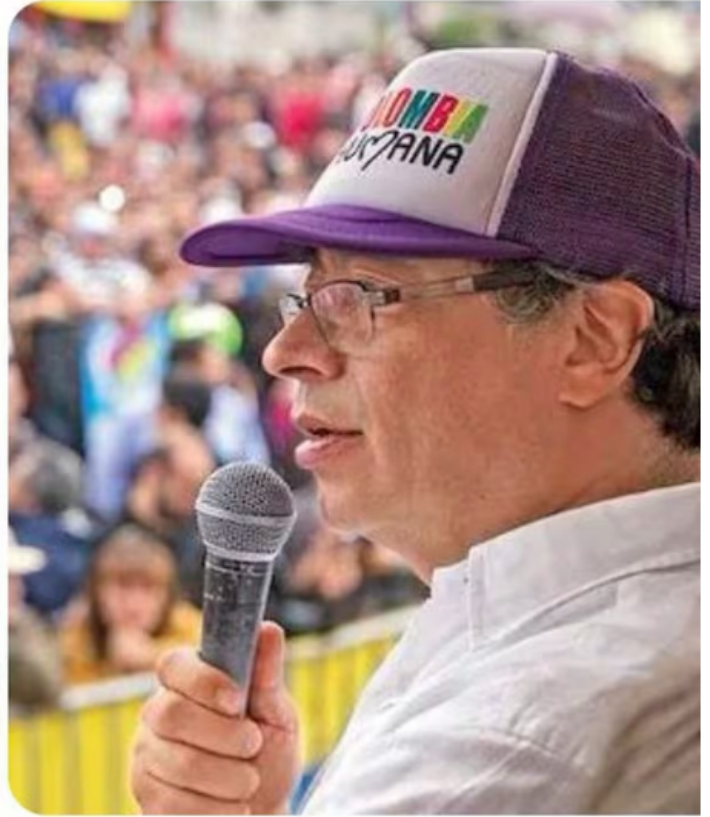
Ricardo Roa fue el gerente de la campaña presidencial de Gustavo Petro.