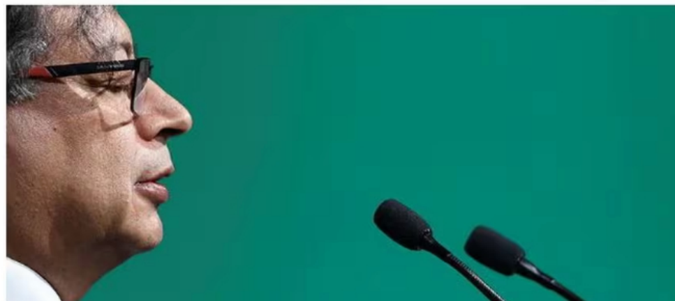
El medio inglés hace una radiografía de los escándalos que rodean al presidente colombiano.

Gustavo Petro's son, brother, and former chief of staff are all under investigation