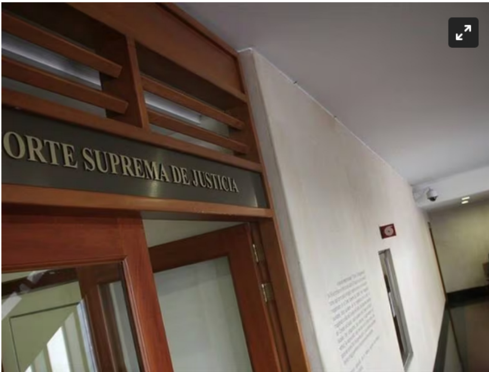
Comisión de Acusaciones escuchará a los magistrados de la Sala Penal de la Corte Suprema.

Esto sería por gastos de campaña de senadores del Pacto Histórico