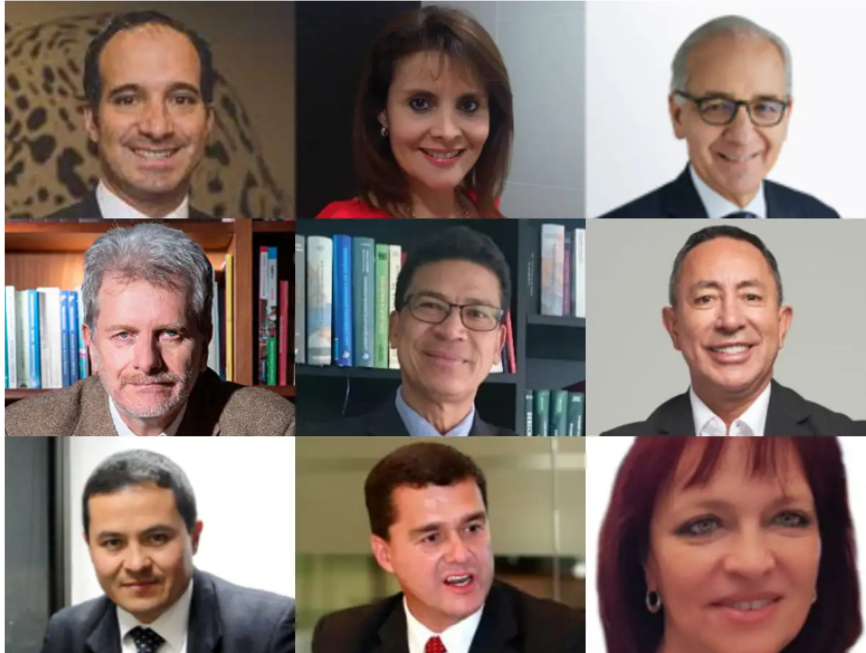
Placha para la Junta de ISA

Bajo la dirección de Ricardo Roa, Ecopetrol viene reformulando su estrategia para hacer que la transición energética sea más protagonista en los planes de la empresa. Para eso será clave lo que pase con los cargos directivos de ISA, una de sus filiales. El gigante colombiano es propietario de la mayor red de transmisión eléctrica de América Latina, y es una compañía que ya pone el 10 por ciento de las ganancias de Ecopetrol .