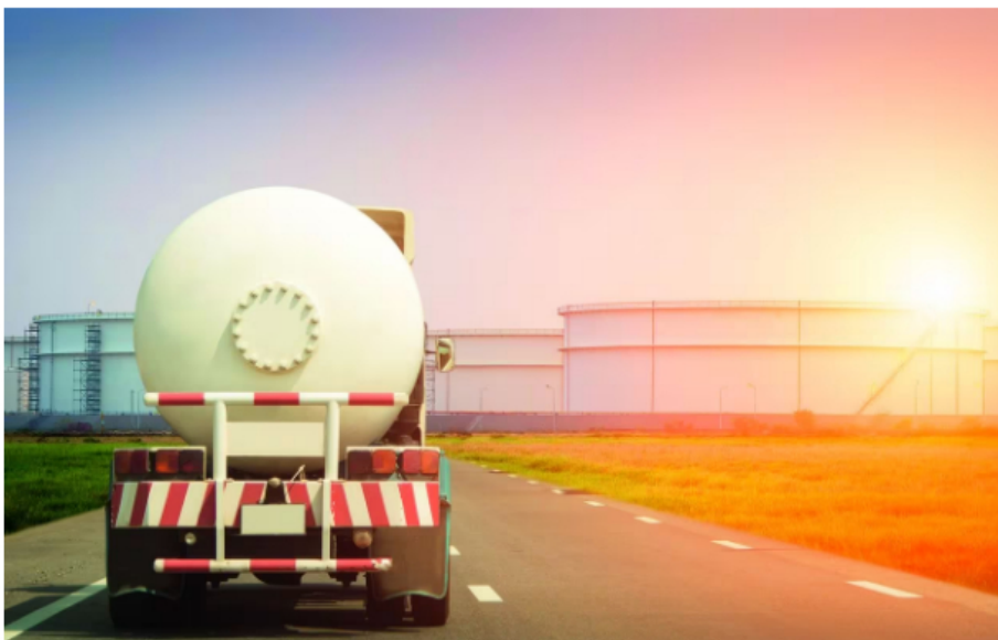
El ACPM representa el 22,4 % del consumo final de energía del país y "es el principal bien industrial de

Desde la trinchera de los agremiados del transporte de carga, no habría escapatoria al incremento de los fletes y las tarifas para los usuarios, tanto del transporte de carga como del servicio de traslado de pasajeros.