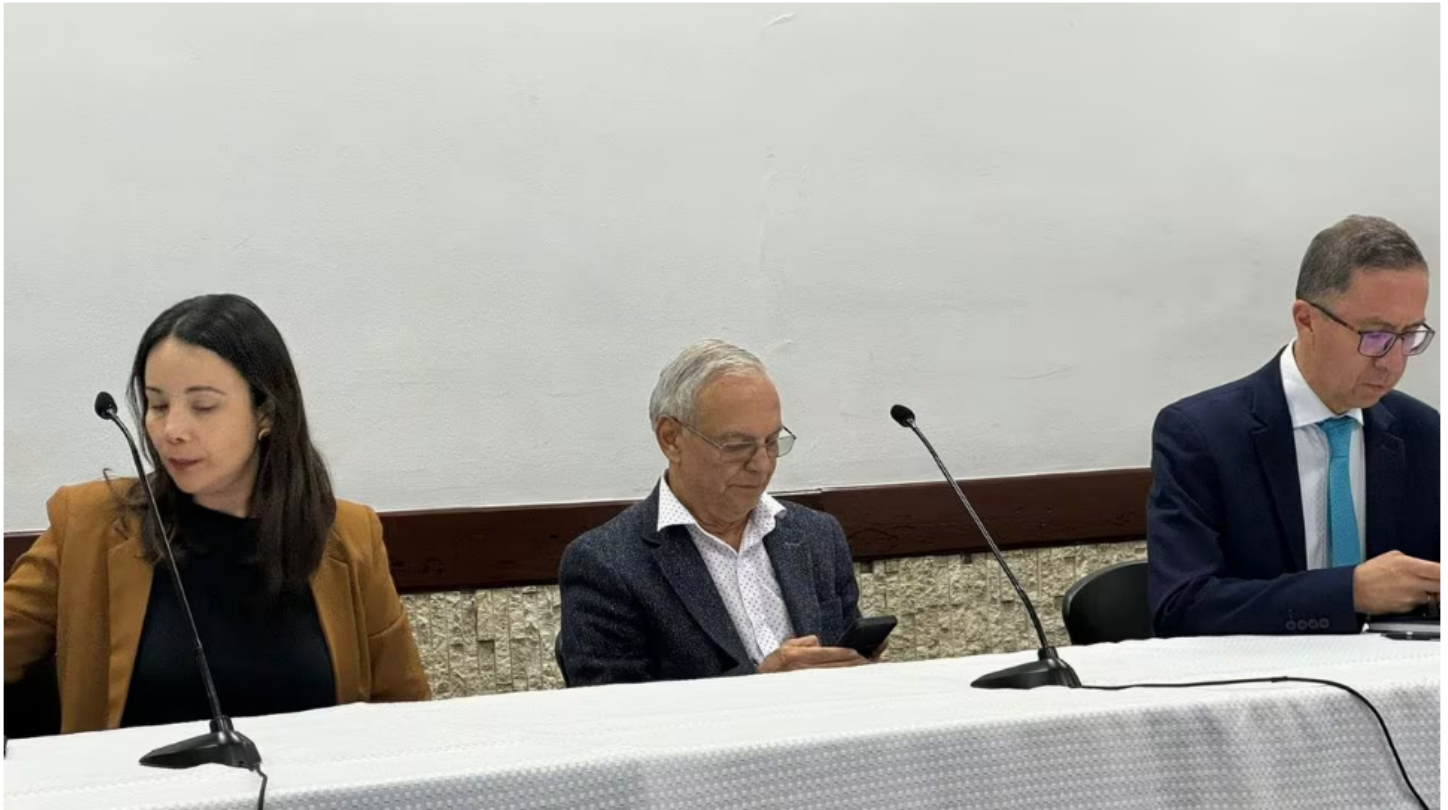
Ministro de Hacienda en negociación de precio de ACP.

De la mesa en la que se busca llegar a un acuerdo sobre el precio del ACPM, combustible que está en boga porque hay un déficit provocado por los subsidios que se aplicaron durante años para mantener un precio estable internamente, pese a aumentos en el internacional, se levantaron sin acuerdo.