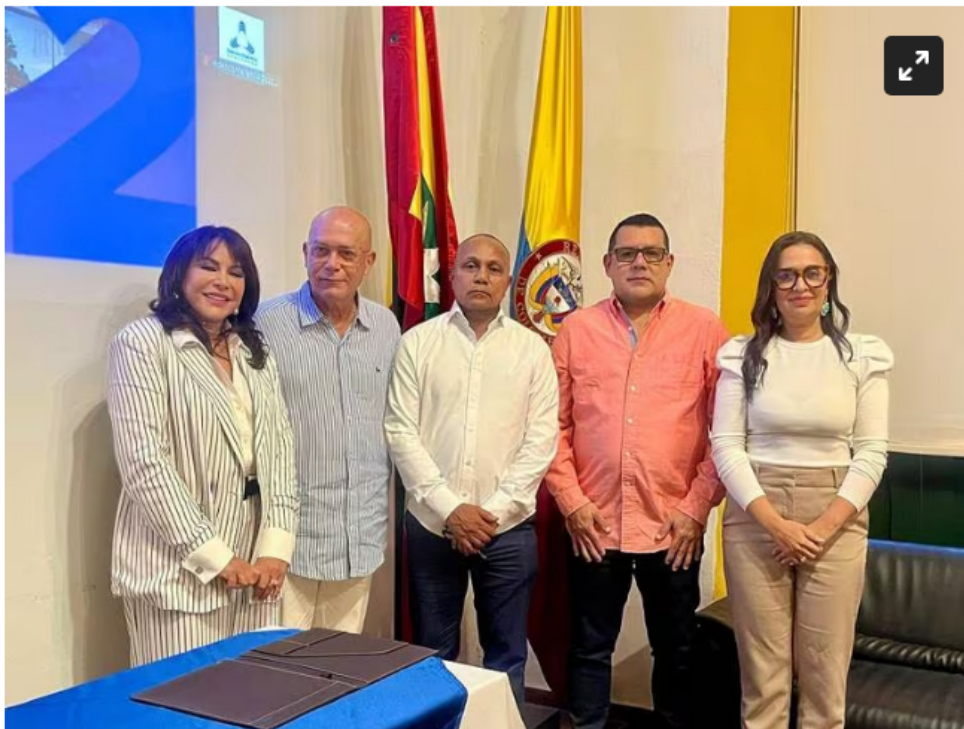
Cámara de Comercio de Cartagena