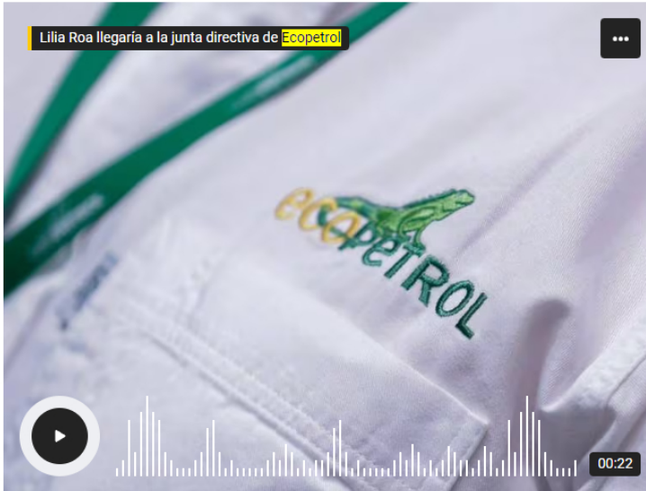
Camiseta con el logo de Ecopetrol

El nombre de Lilia Roa se conoce después de que Edwin Palma, uno de los nombres más opcionados como candidato para la junta directiva de Ecopetrol , fuera designado para ocupar la curul de Piedad Córdoba en el Senado.