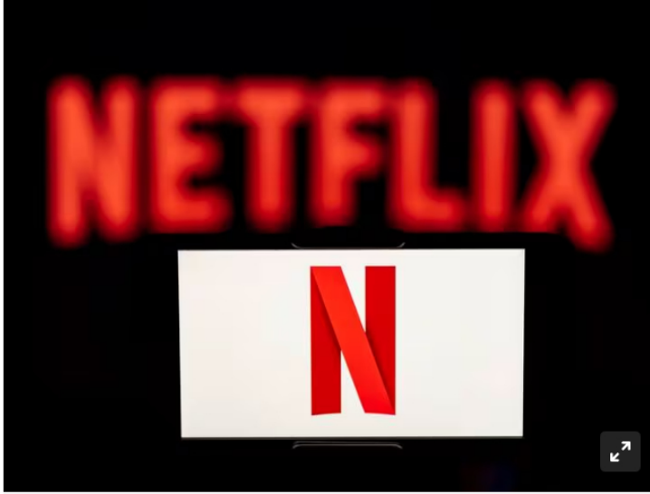
Imagen de referencia.

La compañía anticipa ingresos de 9.240 millones de dólares y un beneficio neto de 1.976 millones de dólares para el primer trimestre de 2024, marcando un panorama optimista para la plataforma de streaming.