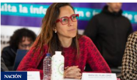
Reactivar economía de Bogotá: este será el