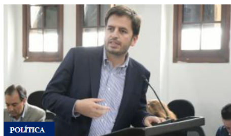
Denuncian que Minsalud dejó vencer más