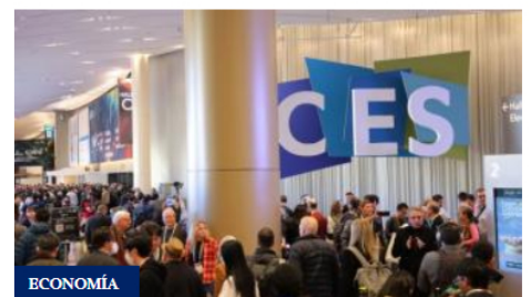
Cambios tecnológicos revolucionaran la