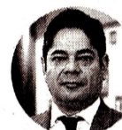
Guillermo Herrera Presidente Ejecutivo de Camacol.

La ministra de Vivienda , Catalina Velasco , dio a conocer que esta semana se inició con las asignaciones del programa Mi Casa Ya en este 2024, con una modificación, se disminuyó de 85% a 70% el porcentaje de obra requerido en el avalúo del inmueble como requisito para acceder al subsidio. La meta de asignación del Gobierno es de 50.000 subsidios anuales, lo que Camacol ya dijo que se quedará corto para reactivar el sector. En total, serán 200.000 subsidios en todo el Gobierno. Para 2024, Mi Casa Ya ofrece un subsidio a la cuota inicial equivalente a 30 salarios para hogares de Sisbén IV , que equivale a $39 millones.