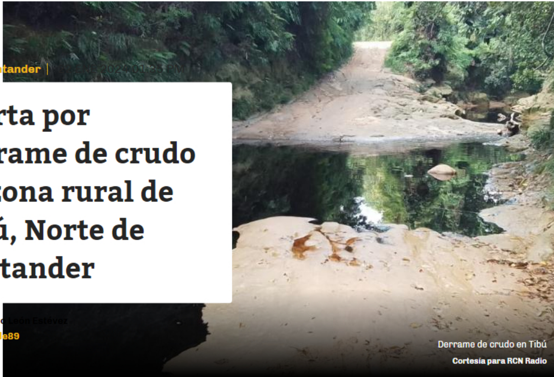
Derrame de crudo en Tibú