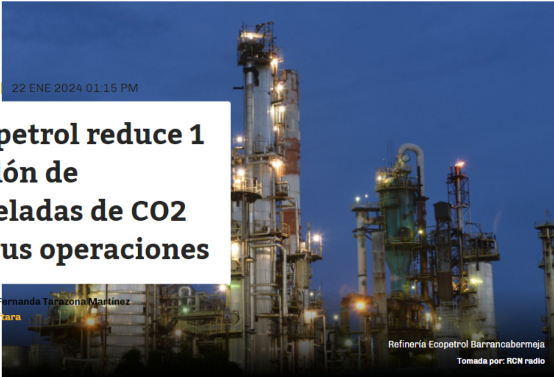
Refinería Ecopetrol Barrancabermeja