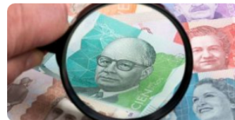
TRM del Dólar en Colombia hoy: Secretos Revelados al 20 de enero de 2024 ¡Descúbrelos en Tiempo Real