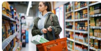
Bienes y servicios desindexados del salario mínimo: ¿qué tanto impactan el bolsillo de los colombianos?