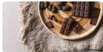
Chocolatería artesanal y de lujo, un mercado por explorar en Colombia