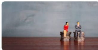
Tributación con enfoque de género: un análisis del caso de Argentina