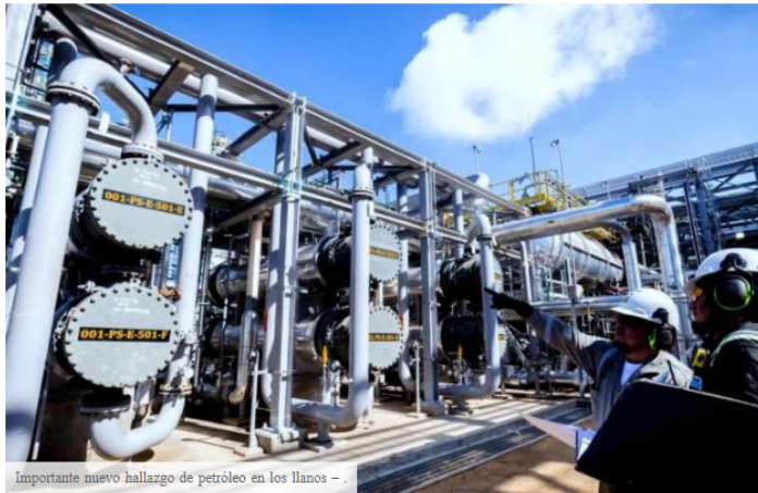
Importante nuevo hallazgo de petróleo en los llanos -