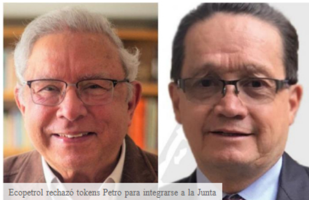
Ecopetrol rechazó tokens Petro para integrarse a la Junta

NEGOCIO Shirley ✓ Noticias about 5 hours ago REPORT