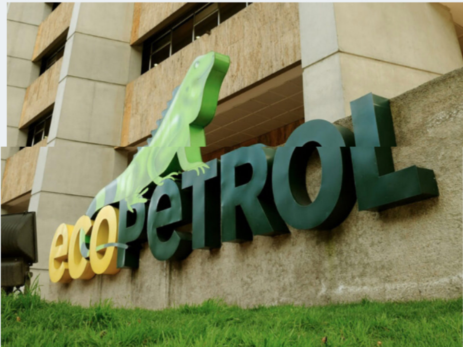
Sede de Ecopetrol.

El presidente de la petrolera estatal colombiana Ecopetrol, Ricardo Roa, ha asegurado que la aportación al Estado de la compañía en concepto de impuestos y dividendos durante 2023 puede alcanzar 55.000 millones de pesos colombianos - unos 12.850 millones de dólares- .