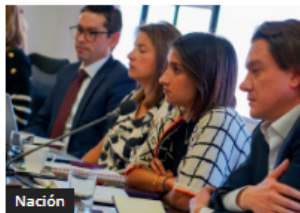
Nación Sector financiero se suma a la construcción del Acuerdo Nacional