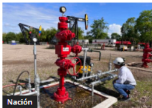
Nación Ecopetrol redujo un millón de toneladas de dióxido de carbono en sus operaciones