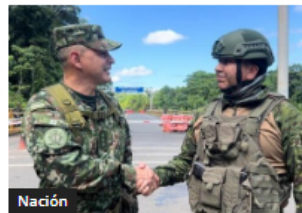
Nación Colombia y Ecuador fortalecen la seguridad en la frontera