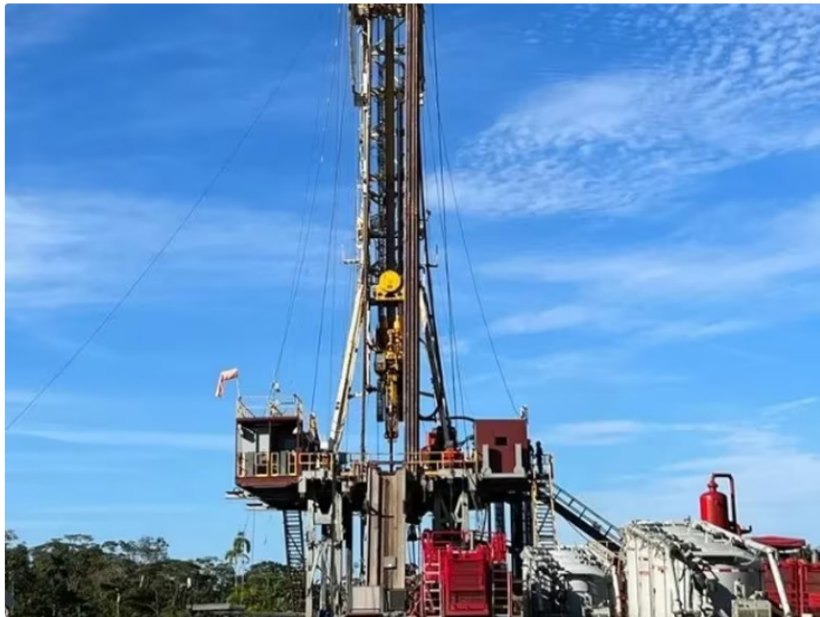
Parex aseguró que las pruebas en los yacimientos de Arauca son prometedoras

Ahora puede seguirnos en WhatsApp Channel y en Google News