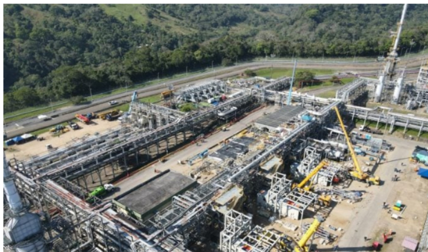
Ecopetrol reportó que ha finalizado con éxito el mantenimiento de la planta de gas Cupiagua.

Un día antes de lo previsto, Ecopetrol reinició las operaciones de la Planta de Gas de Cupiagua , ubicada en el municipio de Aguazul, Casanare , luego del mantenimiento que realizó la empresa en este activo, el cual estaba programado desde las cero horas del cuatro de enero hasta las 12 horas del 15 de enero.