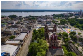
Arrancó la formulación del Plan de Desarrollo de Barrancabermeja

"La comunidad siempre será nuestra prioridad. Debemos equilibrar el bienestar de la ciudadanía y el progreso regional para construir un departamento próspero y sostenible", expresó el gobernador Juvenal Díaz Mateus.