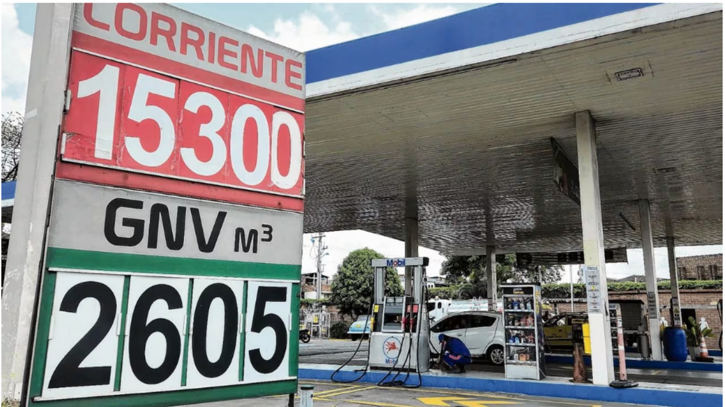
Preocupa a los colombianos cómo se hará el ajuste del precio de la gasolina este año, teniendo en cuenta que el Gobierno dijo que se hará acorde a los precios internacionales.

14 de enero de 2024 Por: Redacción El País