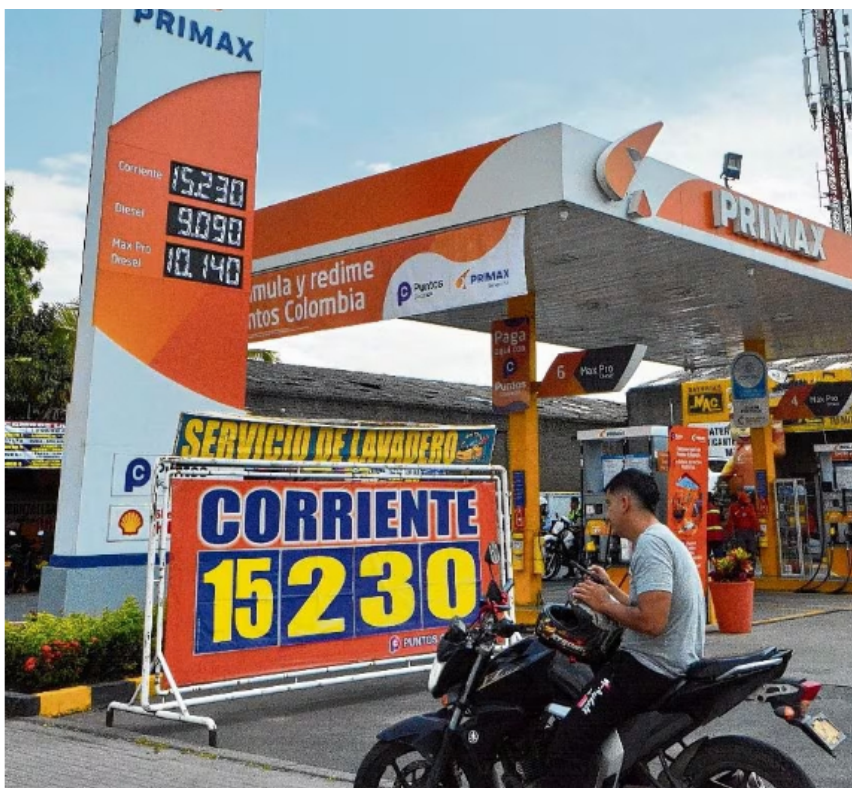
Preocupa a los colombianos cómo se hará el ajuste del precio de la gasolina este año, teniendo en cuenta que el Gobierno dijo que se hará acorde a los precios internacionales.

En días pasados, el ministro de Hacienda Ricardo Bonilla dio algunas luces sobre el tema al afirmar que “en el 2024 no vamos a tocar la gasolina, esa brecha ya se cerró”, refiriéndose a que ya no harán las alzas de $600 mensuales que tenían el objetivo de reducir el déficit del Fondo de Estabilización de Precios de los Combustibles.