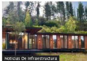
Noticias De Infraestructura

Gopass tuvo un crecimiento de 300 % en 2023: los detalles de su operación en Colombia