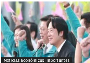
Noticias Económicas Importantes

Lai Ching-te es el nuevo presidente de Taiwán