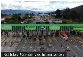
Noticias Económicas Importantes

Lai Ching-te es el nuevo presidente de Taiwán