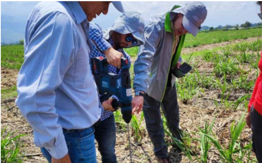
INVESTIGADORES del Servicio Geológico Colombiano durante la recopilación de información en su proyecto de exploración de hidrógeno blanco en el país.

Así se llama al hidrógeno natural, promesa de combustible limpio y más barato. Vea dónde se ha encontrado.