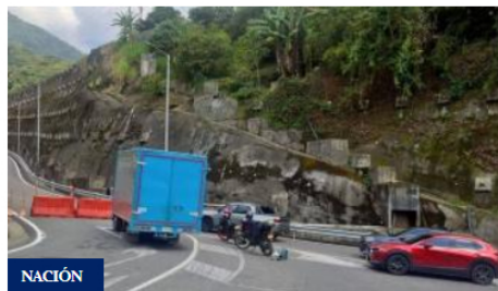
Plan de movilidad para oriente de Cundinamarca anuncia gobernador