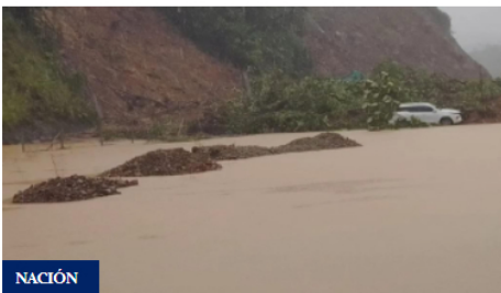
Sube a 33 los fallecidos por derrumbe en vía Medellín-Quibdó