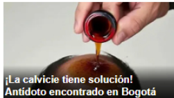
¡La calvicie tiene solución! Antídoto encontrado en Bogotá