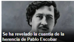
Se ha revelado la cuantía de la herencia de Pablo Escobar