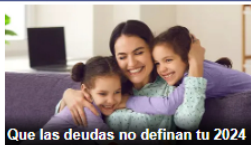
Que las deudas no definan tu 2024