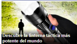
Descubre la linterna táctica más potente del mundo