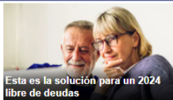
Esta es la solución para un 2024 libre de deudas