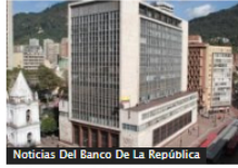
Noticias Del Banco De La República

Asobancaria revela nuevas proyecciones económicas tras dato de inflación de 2023