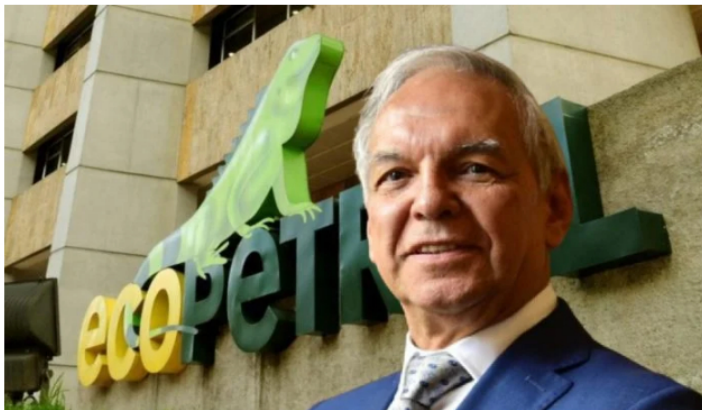
Gobierno Petro Insiste en la Integración vertical de Ecopetrol.

El ministro de Hacienda y Crédito Público de Colombia, Ricardo Bonilla, indicó este miércoles que Ecopetrol tendrá que irse convirtiendo en la primera empresa de energía del país; es decir, abarcando todos los eslabones de la cadena petróleo, gas, energía eléctrica, transmisión, generación, energías renovables e hidrógeno.