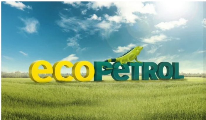
Ecopetrol crearía línea de negocio solo para energías renovables.

El presidente de Ecopetrol, Ricardo Roa Barragán, sobre los avances que ha tenido la compañía con los proyectos de energías renovables -como a eólica-, indicó que desde que se estableció la hoja de ruta 2040 se sigue aspirando que la petrolera sea líder de la transición energética en Colombia en línea con el Plan Nacional de Desarrollo.