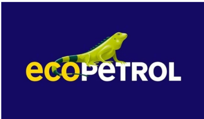
Asamblea aprueba cambios para estar en Junta de Ecopetrol.

Asamblea General de Accionistas de Ecopetrol , en su reunión extraordinaria, aprobó este miércoles una nueva reforma de estatutos de la petrolera en el que cambian las reglas de juego para los requisitos de los miembros de la Junta Directiva entre otras cosas.