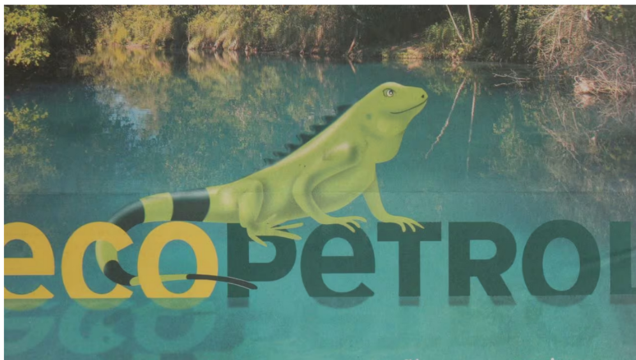
La petrolera reunirá a todos sus accionistas este miércoles 10 de enero.

Este miércoles 10 de enero, la junta de Ecopetrol se volverá a reunir en una asamblea extraordinaria que fue convocada a finales del año pasado por su presidente, Ricardo Roa Barragán.