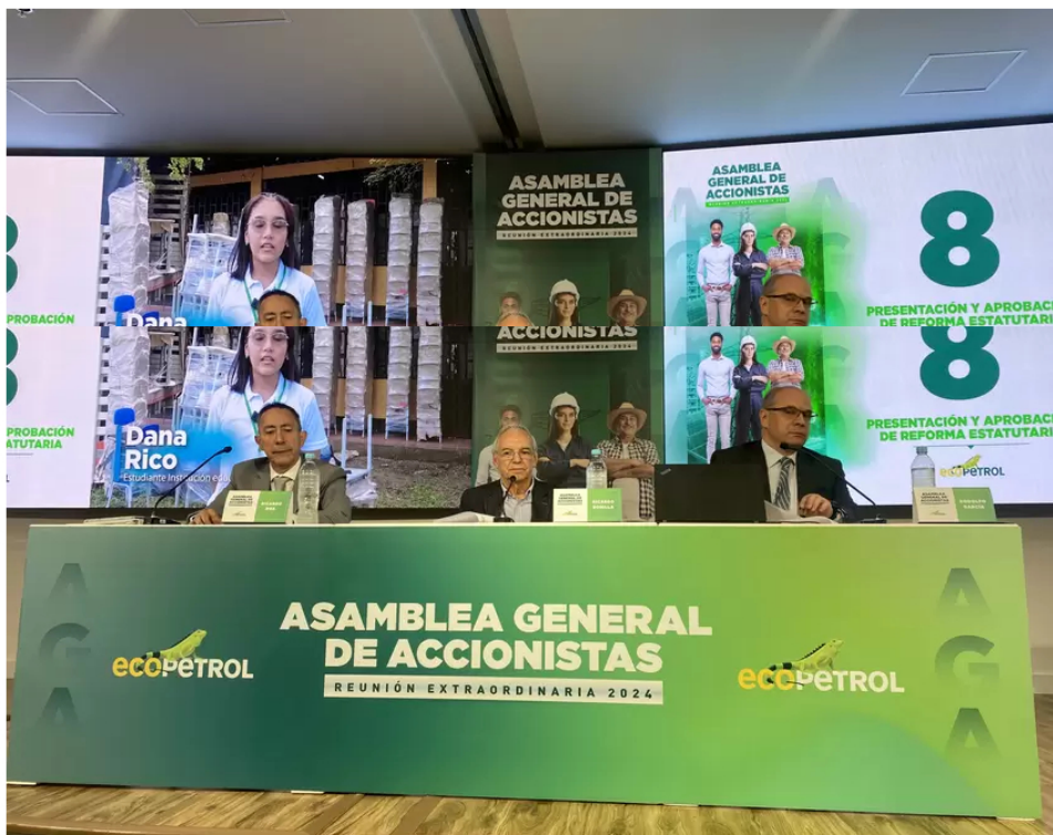
Asamblea de accionistas de Ecopetrol