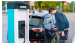
La revolución de los vehículos eléctricos en Brasil continúa y las ventas aumentarán un 60% en 2024