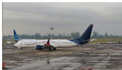
Panamá Copa Airlines navega por la suspensión del Boeing 737 MAX 9