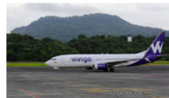
El fenomenal crecimiento de pasajeros del Wingo de Colombia en 2023