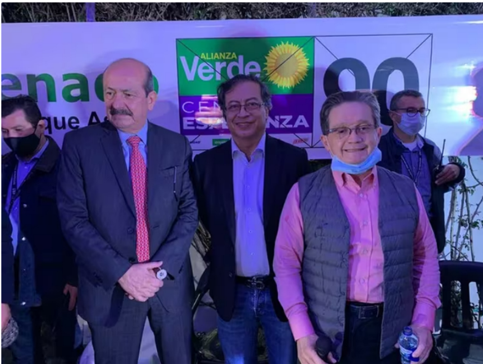
El 21 de enero de 2022 el entonces precandidato presidencial Gustavo Petro anunció que Guillermo García Realpe y Roosevelt Rodríguez oficializaban su apoyo a su campaña presidencial - crédito Colprensa.

Pero hay otro funcionario que el Gobierno busca meter en la dirección de Ecopetrol, según pudo conocer el medio mencionado. Se trata de Gustavo García Figueroa , actual viceministro general del Interior e hijo del exsenador Guillermo García Realpe .