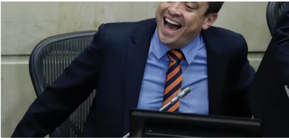
Gustavo García Figueroa, actual viceministro general del Interior - crédito Colprensa.

De acuerdo con El Tiempo , el Ministerio de Hacienda ha defendido la idoneidad de García Figueroa para integrar la junta directiva de Ecopetrol y los cambios en los estatutos ya permitirían su ingreso.