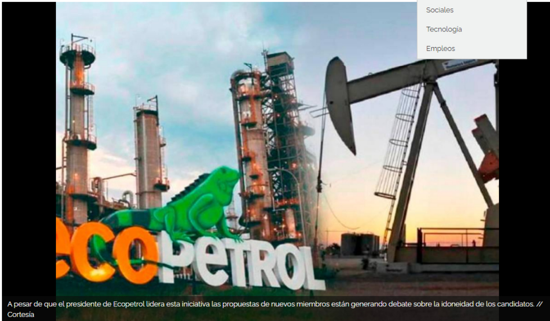
A pesar de que el presidente de Ecopetrol lidera esta iniciativa las propuestas de nuevos miembros están generando debate sobre la idoneidad de los candidatos.

Escuchar el artículo dando click al reproductor: