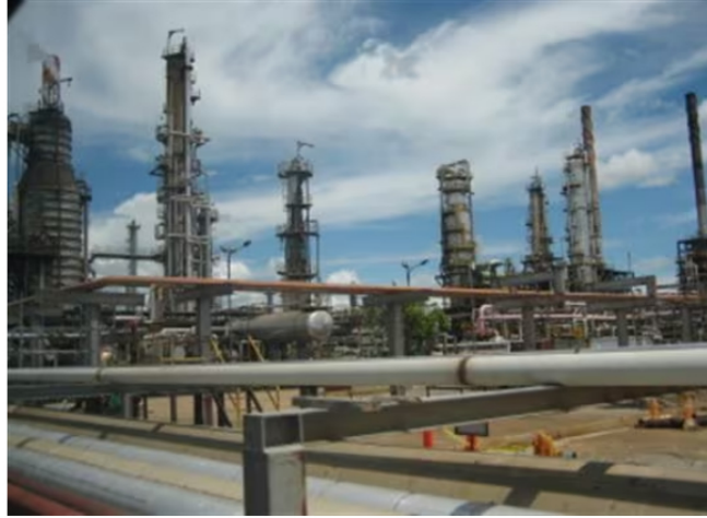
Ecopetrol, empresa petrolera del Estado

Igualmente el líder de la cartera de Hacienda señaló que ya Ecopetrol tiene intervenciones en distintas áreas y por lo tanto se deben generar condiciones para que no parezca que existe alguna insuficiencia o que no pueda actuar en algunas áreas. "Está desarrollando procesos pilótos de hidrógeno y la legislación colombiana debe ser proactiva en estos temas", dijo.