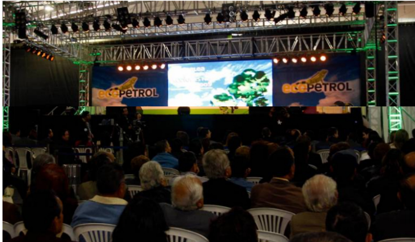
A las 8:30 a.m., en el edificio principal de Ecopetrol en Bogotá se celebrará la asamblea de accionistas.

Accionistas de la petrolera se reúnen para abordar posibles cambios para incursionar en nuevos mercados.