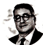
Gustavo Morales Presidente de Fasecolda

Gráfico: LR-MN-GR