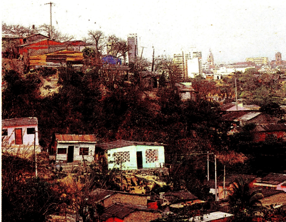
El RUI busca optimizar la entrega de subsidios del Estado a los hogares más pobres.

“Necesitamos focalizar de manera adecuada la capacidad de pago y la generación de ingresos de todos los colombianos. Y eso es una tarea realmente titánica. Y eso es lo que busca el registro universal de ingresos. Identificar toda la capacidad real dinámica del in-