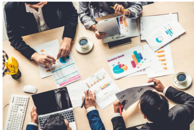
La propuesta del presidente Gustavo Petro de 'reformular la reforma de 2022' sigue generando reacciones entre académicos y gremios.

La propuesta del presidente Gustavo Petro de "reformular la reforma tributaria de 2022 de cara a elevar la actividad productiva del país", apuntaría no solo a mejorar el desempeño de la economía colombiana sino especialmente de la inversión que tuvo una fuerte contracción en el último trimestre del 2023 alcanzando un 11%.