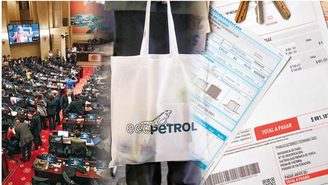
Otras iniciativas distintas a las reformas sociales tienen un espacio en la agenda del Gobierno. Una nueva reforma tributaria, el cambio en la ley de servicios públicos, la reforma agraria y los profundos cambios en Ecopetrol son algunas de ellas.

8 de enero de 2024 Por: Redacción El País