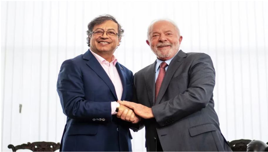
Gustavo Petro y Lula da Silva.