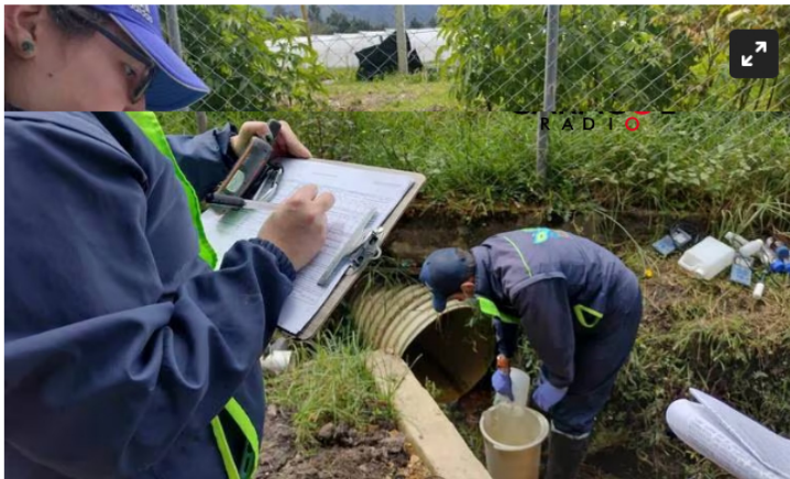
Contraloría indagará sobre posible responsabilidad fiscal y detrimento patrimonial en la ejecución de convenio para construcción de acueducto en Sutamarchán

Fueron más de mil millones de pesos que se invirtieron en un acueducto que beneficiaría a más de 3.000 personas en el municipio de Sutamarchán