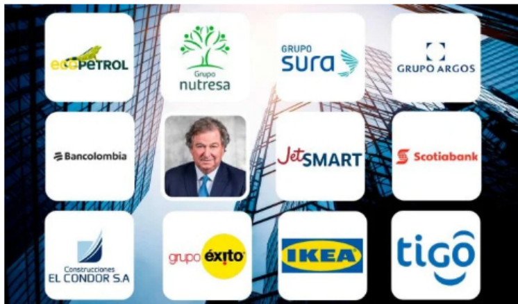
Estas son las movidas y grandes negocios del 2024 en Colombia/Valora Analitik

Con toda la expectativa por lo que depara un nuevo año en el mundo económico y empresarial en Colombia, la atención se centrará en aquellas historias que quedaron en punta en 2023 y los próximos movimientos de algunas de las compañías más grandes como Ecopetrol o Éxito y la expansión de gigantes mundiales como IKEA a más regiones del país.