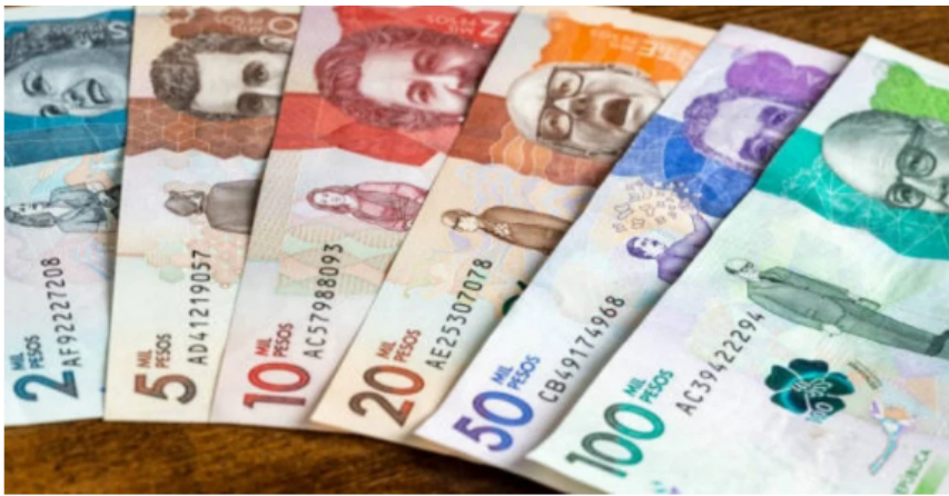
Pesos colombianos.

Cabe mencionar que, con esta decisión del alto tribunal, desde esta cartera se había anunciado un recorte en el Presupuesto General de la Nación (PGN) para el 2024.