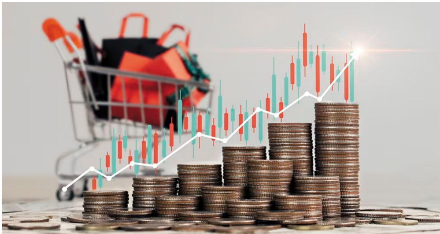
La economía del país podría tener una recuperación grande para el 2024.

Para ese mes, el ISE se ubicó en 119,80, lo que representó un decrecimiento de 0,41 por ciento respecto al mismo mes de 2022. Las actividades secundarias – industrias manufactureras y construcción – registraron un decrecimiento de 5,20 por ciento respecto al mes de octubre de 2022; mientras que las terciarias – servicios públicos, comercio, transporte, alojamiento y servicios financieros, entre otras actividades – tuvieron una caída de 0,36 por ciento.