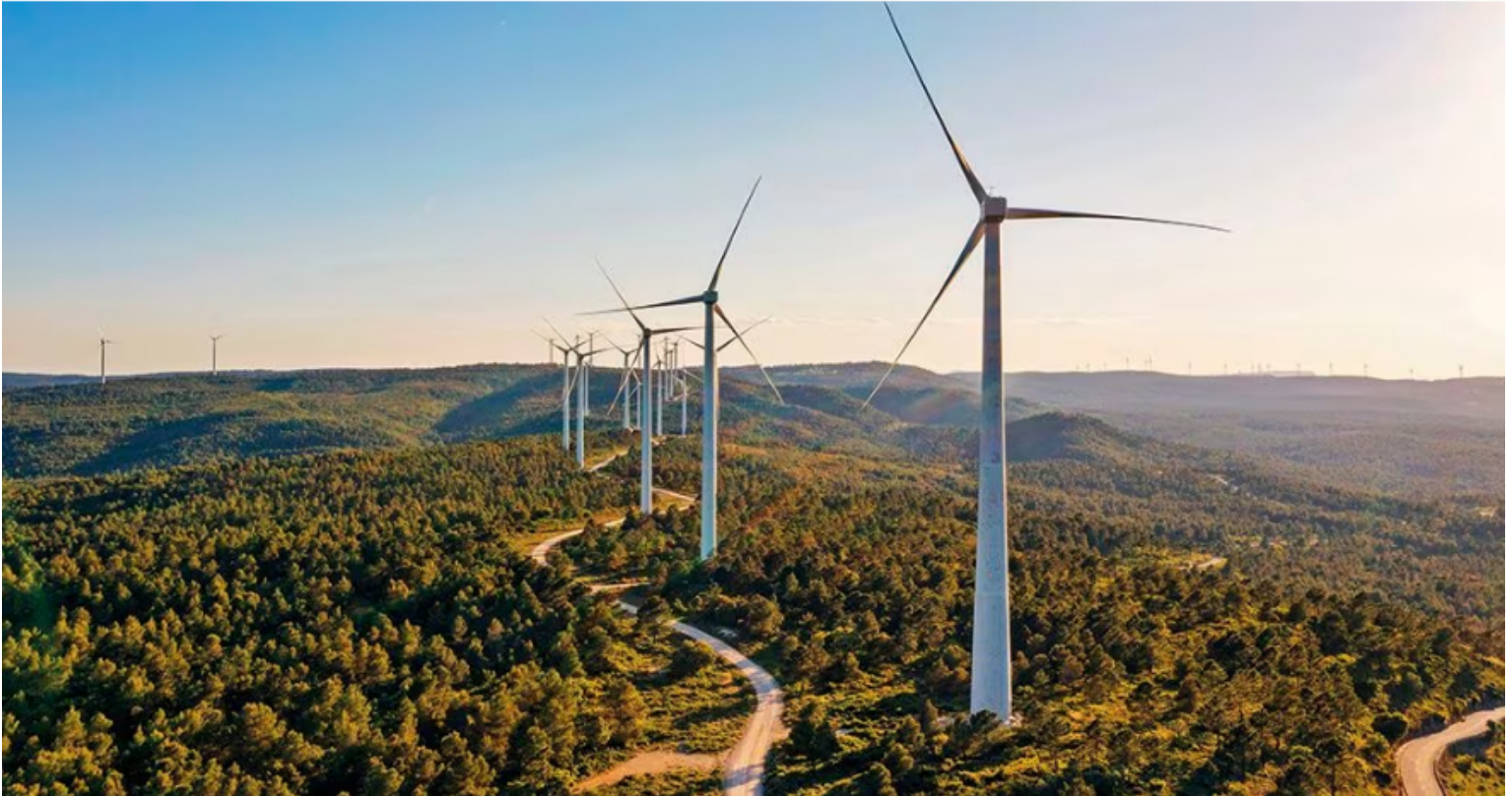
Se espera que se destraben los procesos de licenciamiento ambiental en los proyectos de energías renovables no convencionales, en especial en La Guajira.

En su última reunión del año anterior, la Junta Directiva del Banco de la República decidió, por mayoría, iniciar el ciclo de reducción en las tasas de interés y pasar de 13,25 por ciento a 13 por ciento, una medida que recibieron con satisfacción el Gobierno y el sector privado, que la han venido solicitando, a la espera de que siga esa senda durante este año, al ritmo en que baja la inflación. Según el sondeo de SEMANA, los analistas en promedio estiman que las tasas cierren este año en 8,09 por ciento.