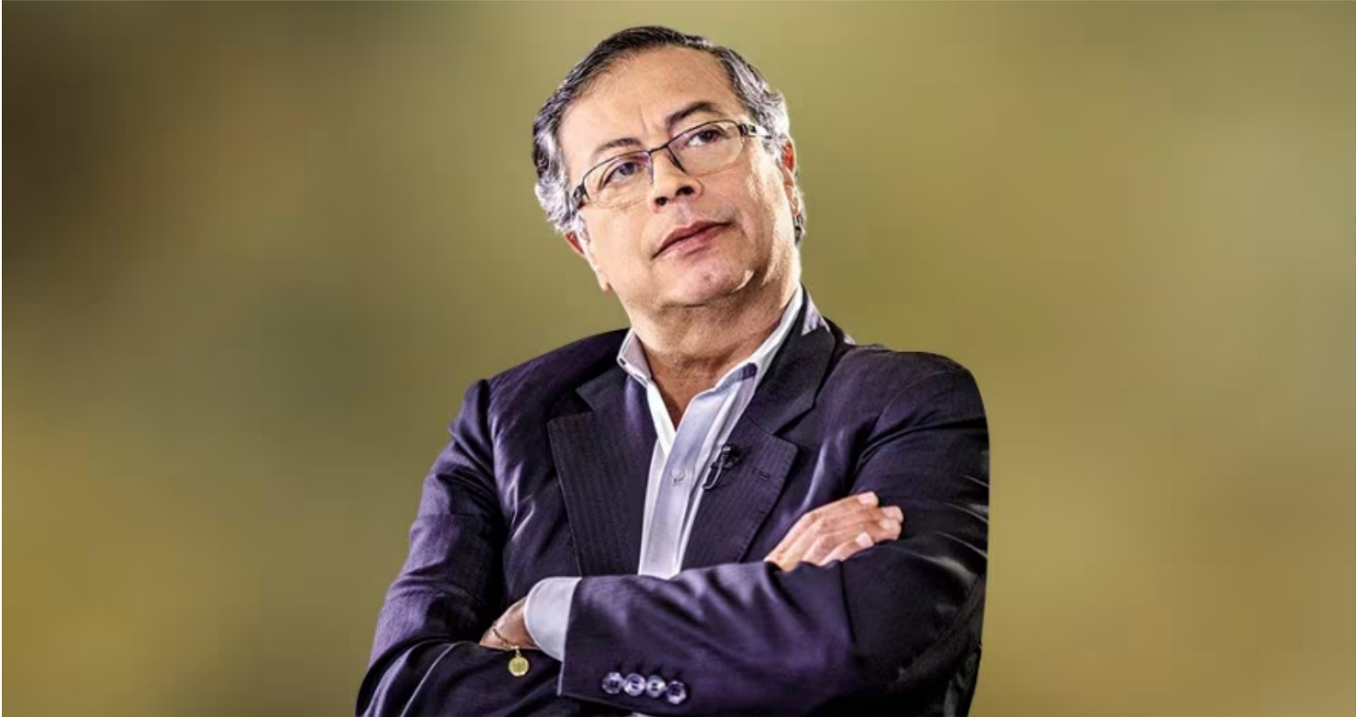
Gustavo Petro, presidente de Colombia.

Por el lado de la infraestructura, en el Gobierno Petro no se ha dado un solo proyecto nuevo de concesiones viales y, por el contrario, la decisión de suspender en 2023 el aumento en las tarifas de los peajes generó un mal ambiente entre los concesionarios y los posibles nuevos inversionistas por un cambio en las reglas del juego.