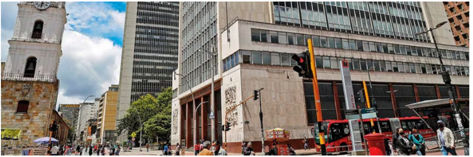
En la reciente reunión de la Junta Directiva del Banco de la República se inició la senda de reducción de las tasas de interés, que pasaron de 13,25 por ciento a 13 por ciento.