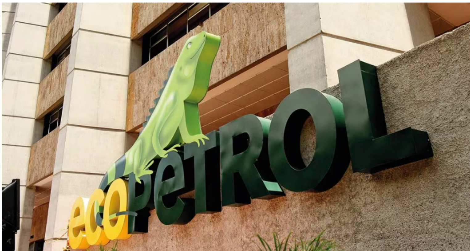
Una de las mayores expectativas está en el desarrollo de la anunciada alianza entre Ecopetrol y PDVSA. ¿Hasta dónde puede llegar? ¿Qué riesgos tiene?

Frente a la reforma laboral, las mayores críticas son en torno a que está enfocada más hacia quienes tienen hoy empleo que a buscar la creación de nuevos y mayores puestos de trabajo y a reducir la informalidad (cercana hoy al 60 por ciento), al tiempo que encarece los costos laborales.