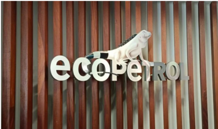
Logo Ecopetrol.

Recomendado: Ecopetrol busca empresas de tecnología para proyectos de transición energética