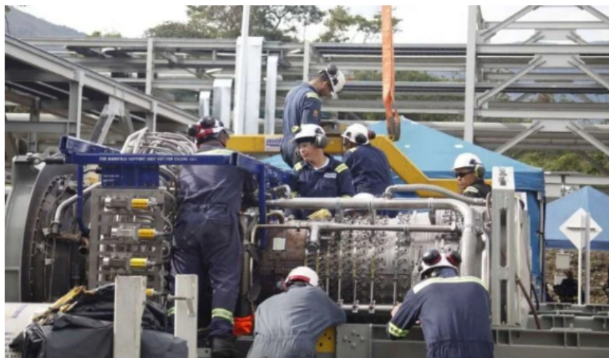
Planta Cupiagua de Ecopetrol