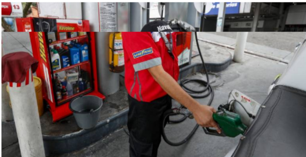
El precio interno en Colombia está 51% por debajo del valor promedio internacional.

El valor promedio internacional está en $18.630 y el diferencial lo está subsidiando el Gobierno. Expertos creen que debe iniciar el ajuste o el costo será billonario.