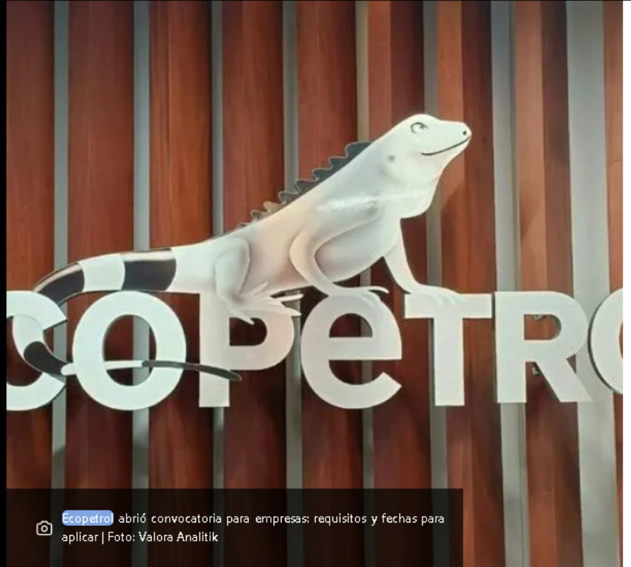
Ecopetrol abrió convocatoria para empresas: requisitos y fechas para aplicar