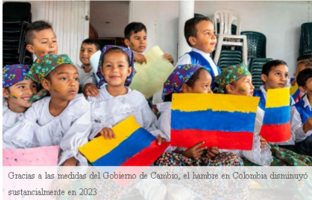
Gracias a las medidas del Gobierno de Cambio, el hambre en Colombia disminuyó sustancialmente en 2023

En su mensaje de fin de año, el presidente Gustavo Petro dijo que el precio de la gasolina, a partir de enero, comenzará a variar según el precio internacional. "Subirá si sube y bajará si baja, por el contrario. "Esto nos permitirá liberar 10 mil millones de pesos anuales de los dividendos de Ecopetrol que ahora financiarán el gasto social del país".