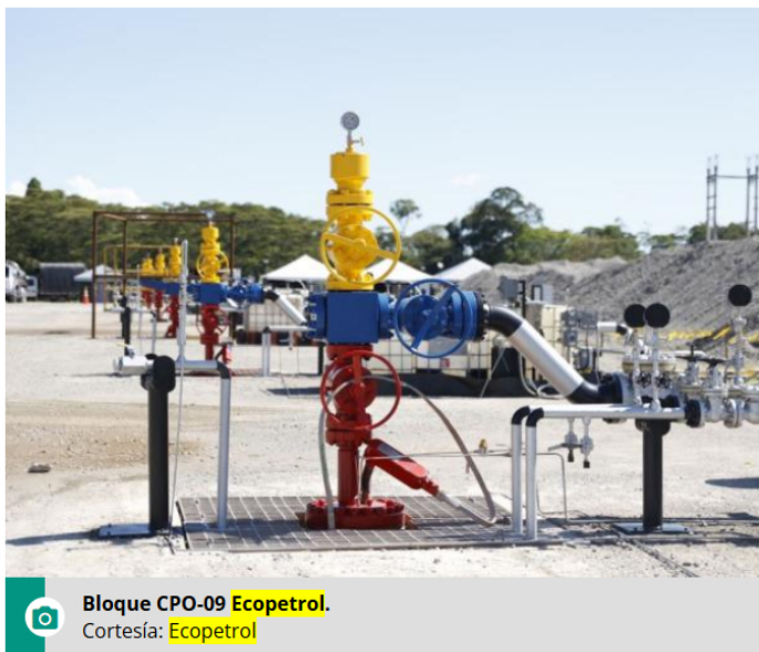
Bloque CPO-09 Ecopetrol.

El funcionario señaló que posteriormente a ello entre Repsol y Ecopetrol se firmó un contrato de operación conjunta el 4 de marzo de 2010 .