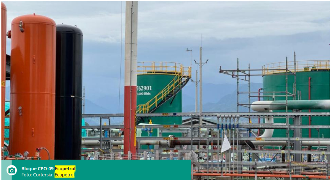
Bloque CPO-09 Ecopetrol . Foto: Cortesía: Ecopetrol

La petrolera adquirió el 44,5% de la participación con la que contaba Repsol.